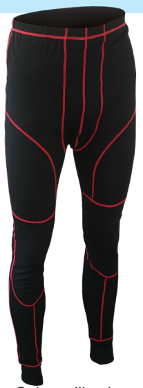
Calzoncillos largos Ref. SABA