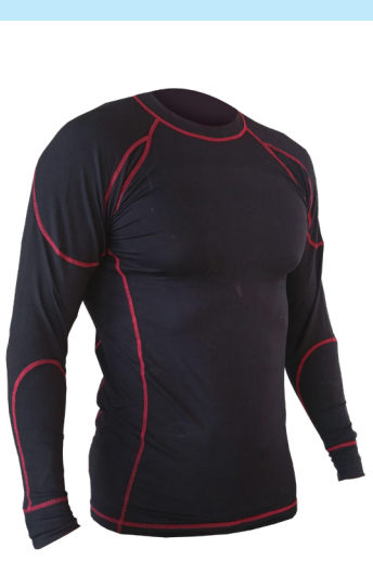
Camiseta mangas largas Ref. SAHO