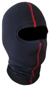
Capucha Ref. SAGA