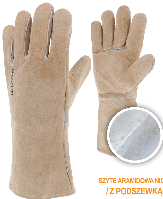
SZYTE ARAMIDOWA NICIĄ / Z PODSZEWKĄ